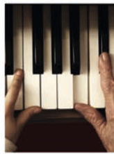
Tieu Khe-Mayer (CH)